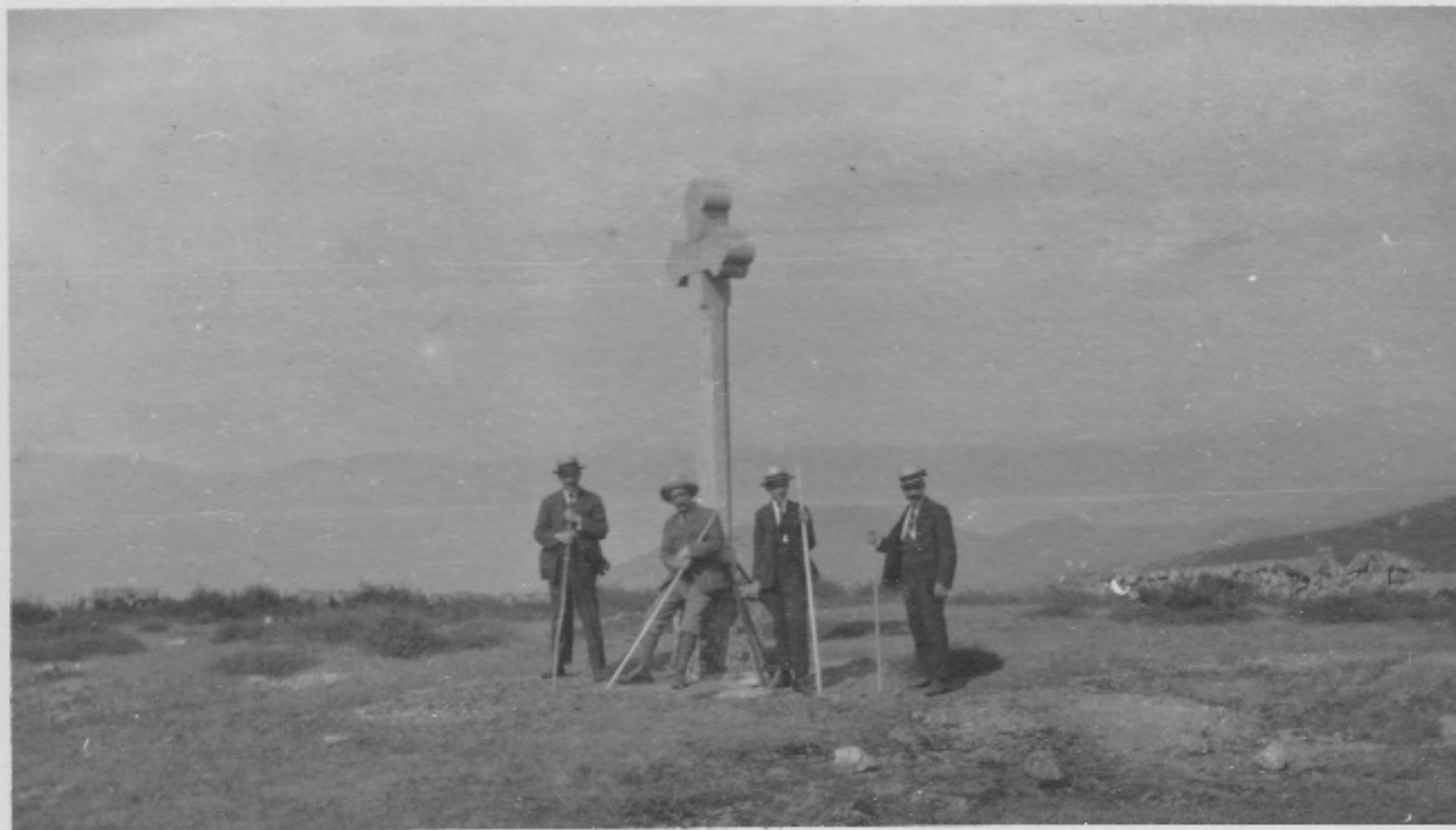
Souvenir de Caldelas - Sept. 1920

Samuel Schwarz com um pequeno grupo em Caldelas (setembro de 1920).