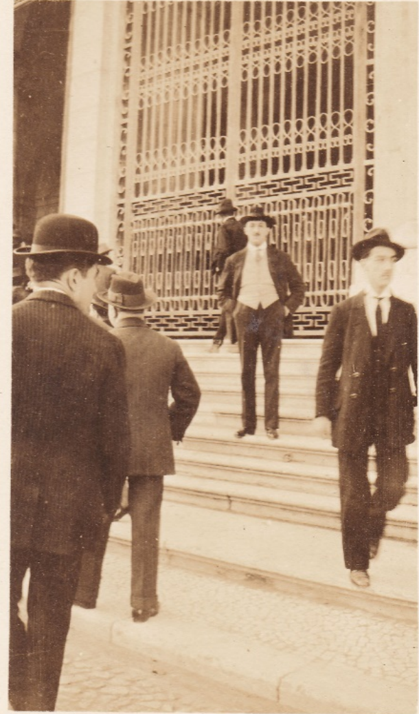
Samuel Schwarz à entrada do Parlamento (1914).