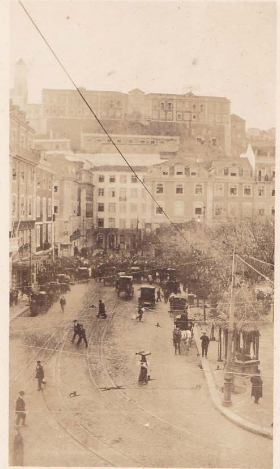
Lisboa, vista do Rossio (janeiro de 1915).

Lisbonne - Vue du Rossio janvier 1915. -