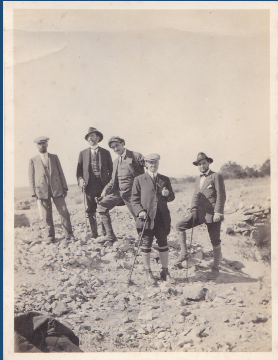
Grupo de trabalho nas minas, Ribadavia.