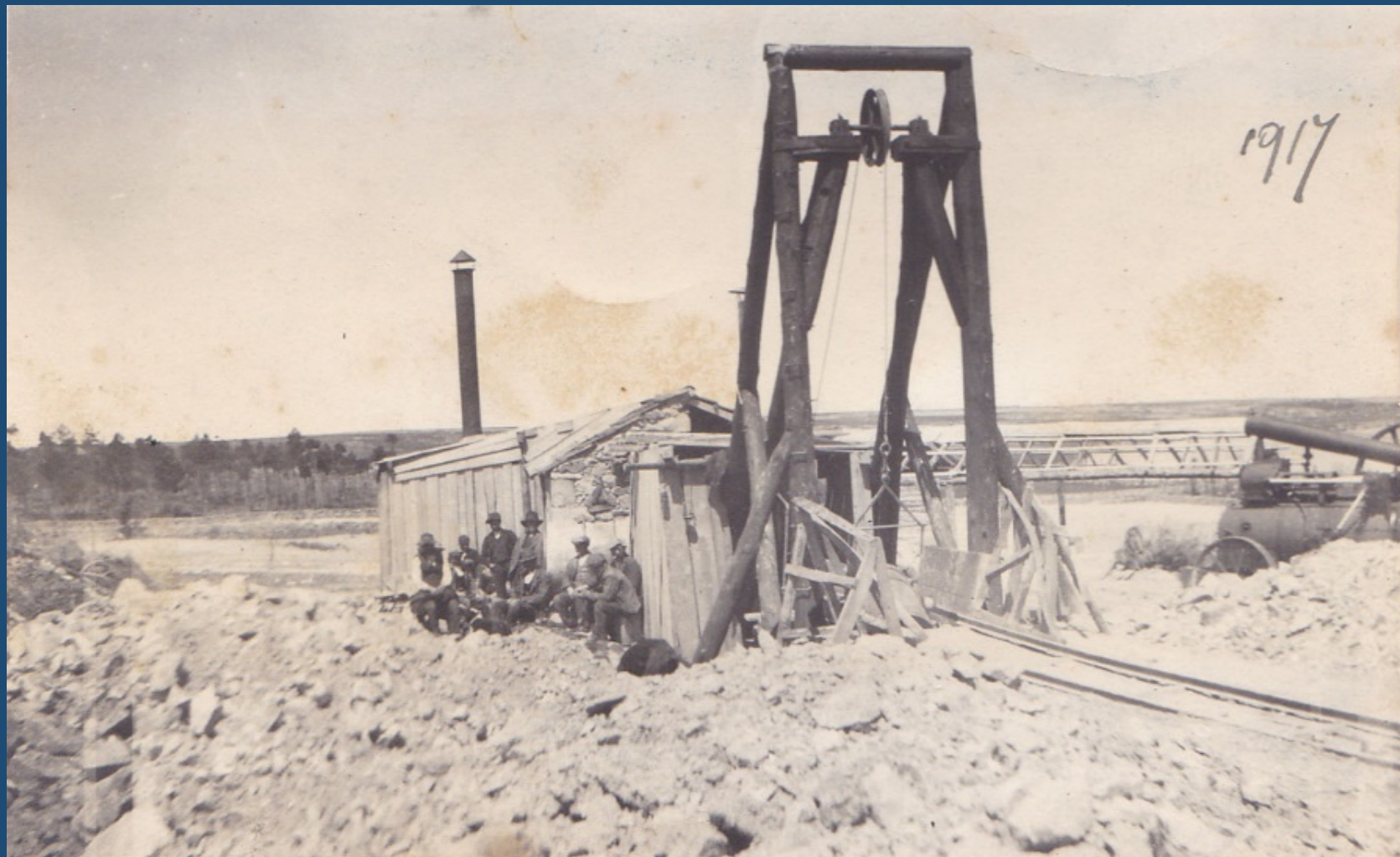
Grupo de trabalho nas minas (1917).